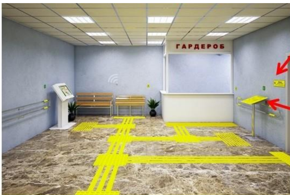
13. Кабинетная табличка