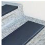
9. Накладки на ступени